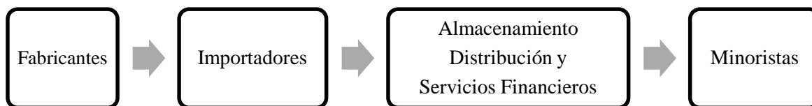
Figura 1. Cadena de suministro convencional

producción y la entrega de un producto final o servicio, desde el proveedor del proveedor al cliente del cliente”, a la cual se le denomina cadena de suministro convencional (ver figura 1).