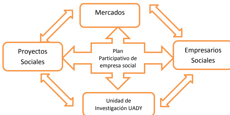
Figura 2. Diagrama sistémico de intervención.

En la actualidad existe un grupo de empresarios dispuestos a inyectar capital de hasta $5,000.00 (son: cinco mil pesos) en esta etapa incipiente de la intervención para el desarrollo de proyectos de negocios con perfil de éxito. El grupo de investigación-acción de la UADY de forma participativa construye un plan de negocios, el cual será el vehículo de enlace entre los proyectos financieros y sus inversionistas sociales.