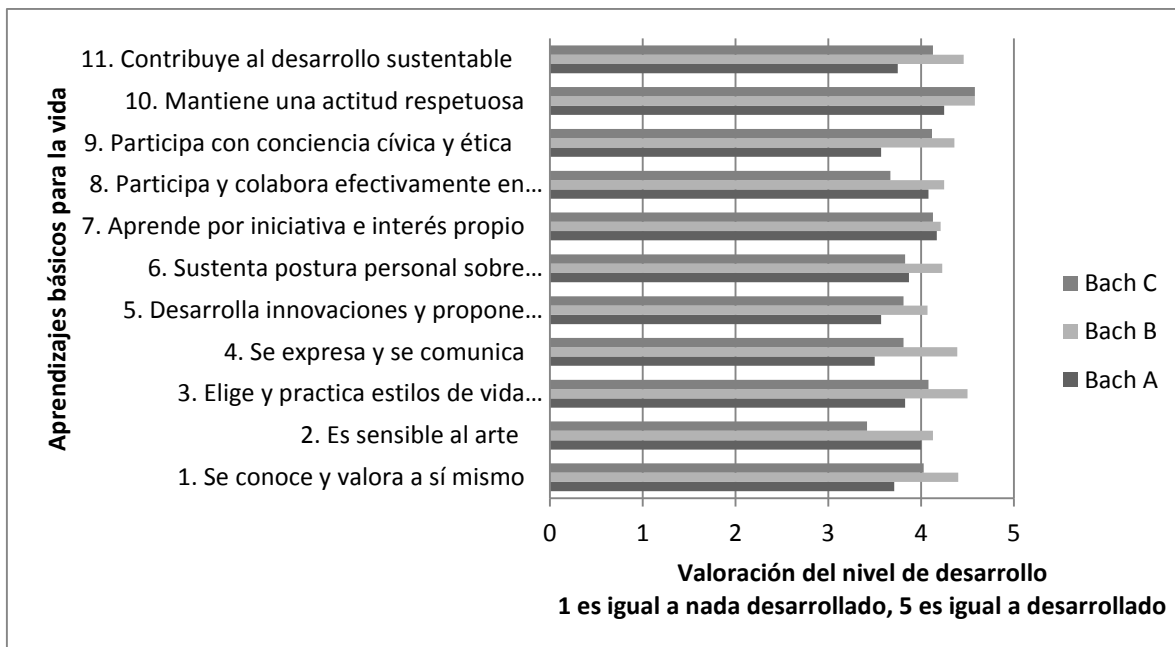
Gráfica 1. Valoración que perciben los estudiantes acerca del nivel de logro de los aprendizajes básicos para la vida en sus bachilleratos de procedencia