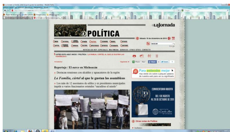
Figura 3. Problemas de los productores agrícolas