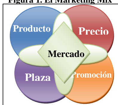
Figura 1. El Marketing Mix