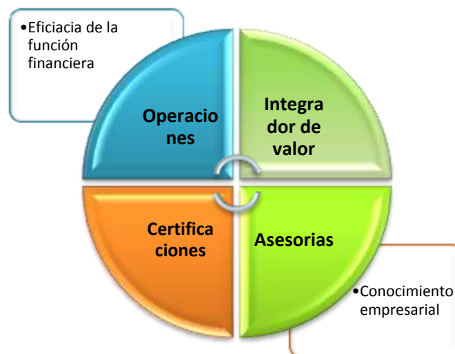
Figura 1. Eficacia y conocimiento. El nuevo integrador de valor.