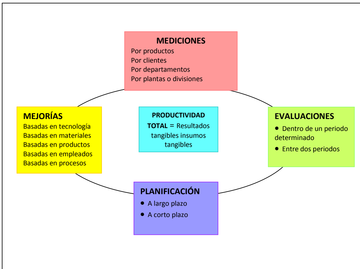
Figura 2.1. Modelo de la productividad.

En la perspectiva de la productividad total, todas las mejoras parten de un sistema de medición basado en la productividad. Una taxonomía de las metodologías para la medición de la productividad confirma el hecho de que, desafortunadamente, la mayoría de los sistemas de medición están orientados hacia la productividad parcial. De todos los sistemas de medición basados en la productividad total, únicamente el modelo de productividad total de Sumanth es aplicable a todos y cada uno de los niveles, desde el aspecto corporativo hasta la especificación de las tareas por realizar, así entonces, a continuación presentamos este modelo.