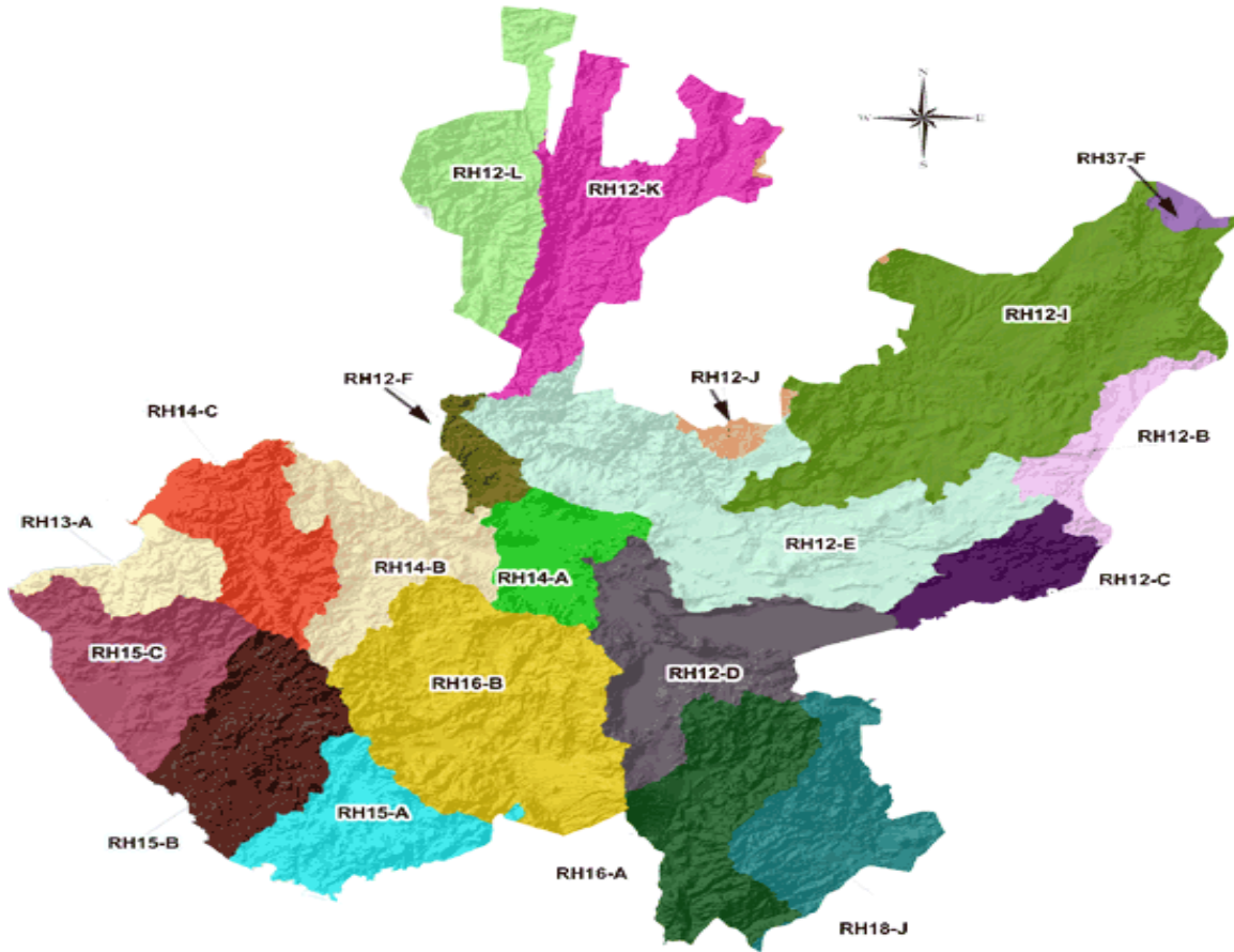
Mapa No. 2: Las 20 cuencas hidrológicas en Jalisco.